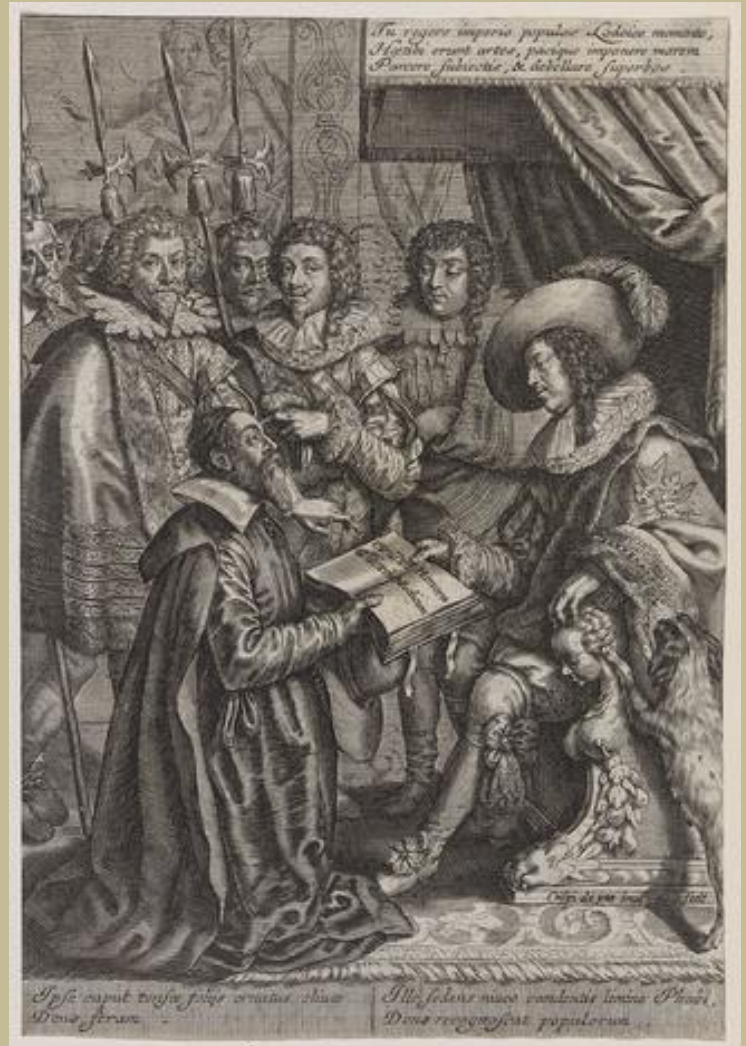
El médico Jean Riolan presenta su libro de anatomía a Luis XIII. Grabado de Crispin de Passe († 1637), París, Denys Moreau, 1626.