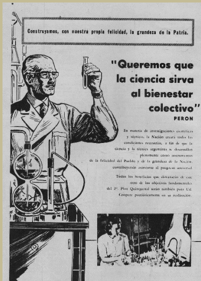
Revista Caras y caretas, 1953.